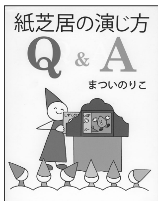
紙芝居の演じ方 まついのりこ 童心社