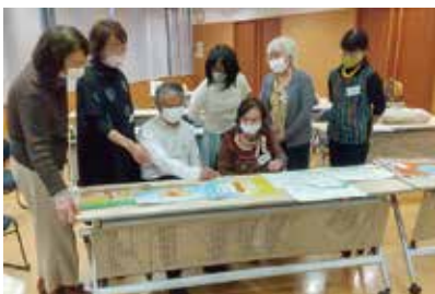
受講生も一緒に意見交換