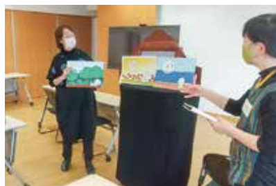
作品への丁寧なアドバイス