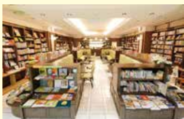
※協力：ブックハウスカフェ (神田神保町)