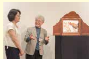
(2018年 講座内容「作品内容をとらえて演じよう」より)