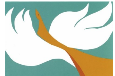
平和紙芝居「二度と」より (松井エイコ作)