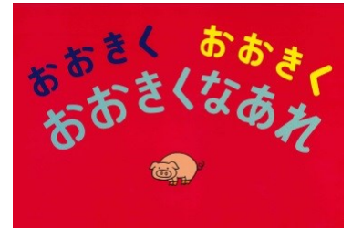
紙芝居「おおきくなあれ」より (まっいのりこ作)